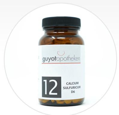
Nr. 12 - Calcium Sulfuricum Das Salz der Gelenke