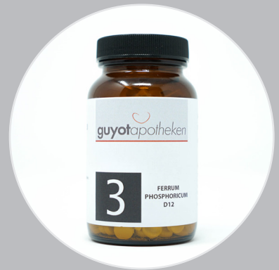
Nr. 3 - Ferrum Phosphoricum Das Salz des Immunsystems.