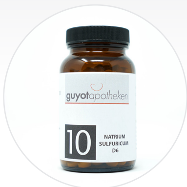
Nr. 10 - Natrium Sulfuricum Das Salz der inneren Reinigung.