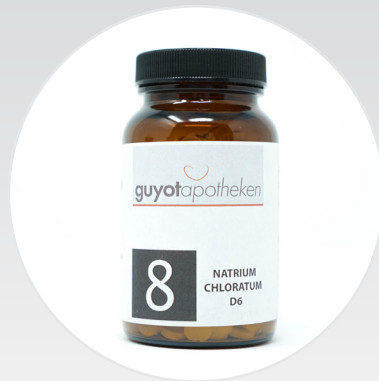
Nr. 8 - Natrium Chloratum Das Salz des Flüssigkeitshaushalts.