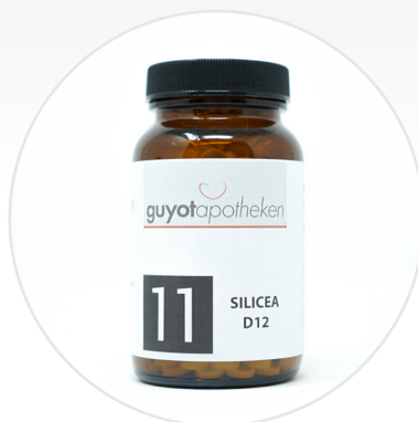
Nr. 11 - Silicea Das Salz der Haare, Haut und des Bindegewebes.