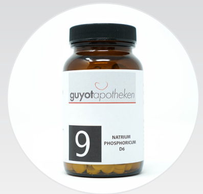
Nr. 9 - Natrium Phosphoricum Das Salz des Stoffwechsels.