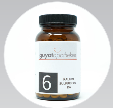
Nr. 6 - Kalium Sulfuricum Das Salz der Entschlackung.