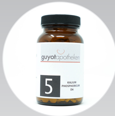
Nr. 5 - Kalium Phosphoricum Das Salz der Nerven und Psyche.