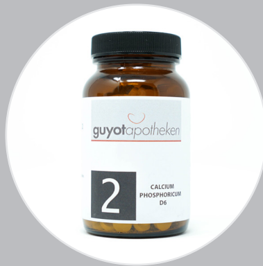
Nr. 2 - Calcium Phosphoricum Das Salz der Knochen und Zähne.