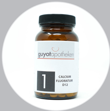
Nr. 1 - Calcium Fluoratum Das Salz des Bindegewebes, der Gelenke und Haut.