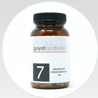
Nr. 7 - Magnesium Phosphoricum Das Salz der Muskeln und Nerven.